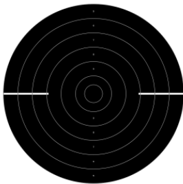
25 m silhuettskive

Fin og Grov skytes på en enkelt standard Silhuettskive på 25 meters hold, 6 serier à 5 skudd, fordelt på denne måten: